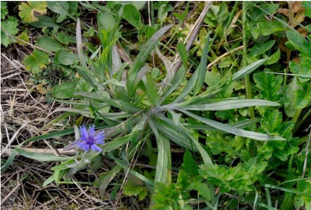
Een bloeiende Korenbloem (Wel een niet al te fraai exemplaar)

Ik loop nu vooral in eigen buurt rond en spotte toch al enkele bloeiende planten. Een paar fotootjes om jullie warm te maken.